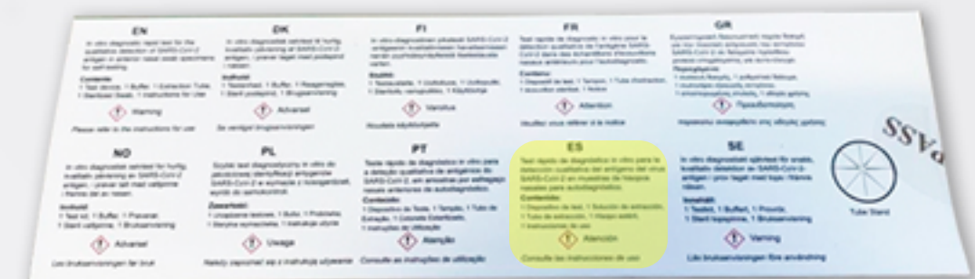
Parte Posterior: Traducción en Castellano.